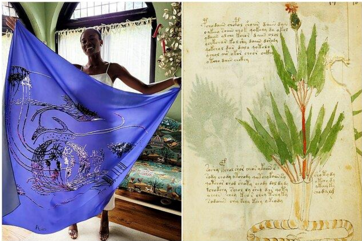
Skraistės ir jų motyvai

LRT Pasaulio Lietuvių Balsas, 2022.11.23